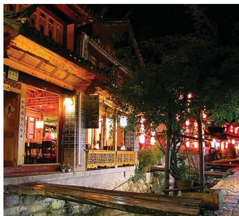
Lijiang - une ville allumée sous la nuit

Lijiang est toujours une charnière importante qui lie Yunnan avec Sichuan et le Tibet. C'est également un endroit de noyau dans la route de Thé-Cheval. D'autres endroits le long de la route de Thé-cheval, comme Xishuangbanna, Simao, Pu'er et Dali, sont connus de leur rôle important dans les trafics, grâce à la plantation du thé et à la fabrication du thé faisant. Malgré qu' on ne produise pas de thé à Lijiang, la ville est l'une des parties les plus importantes sur la route antique de sa position géographique.